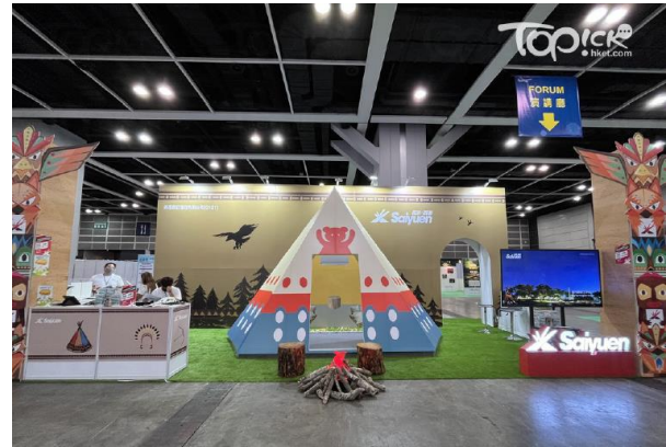
▲ 所有入境措施已回復疫情前的泰國，攤位設有免費旅遊書派發。 ▲ 近幾年大受歡迎的本地豪華營地，亦有攤位展出。

泰國攤位亦有齊全的旅遊書、機票及酒店資料，亦將舉行多場分享會，介紹當地的食買玩、航班及酒店資訊。