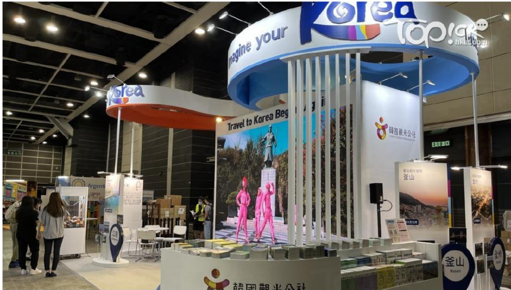
▲ 今屆旅遊展有港人熱門目的地韓國、台灣、日本及泰國設攤位，提供最新資訊。（張頌婷攝）

近日香港政府終於放寬了入境檢疫限制，相信港人恨飛恨到心癢癢，旅遊復甦在望，不妨先參觀一年一度的香港國際旅遊展（ITE）。展覽由即日起至8月21日舉行，並有27個參展國家及地區，比往年多近5成。雖然不及以往熱鬧，但仍有港人熱愛的日韓台泰攤檔，提供最新的旅遊資訊、豐富禮品及折扣優惠。