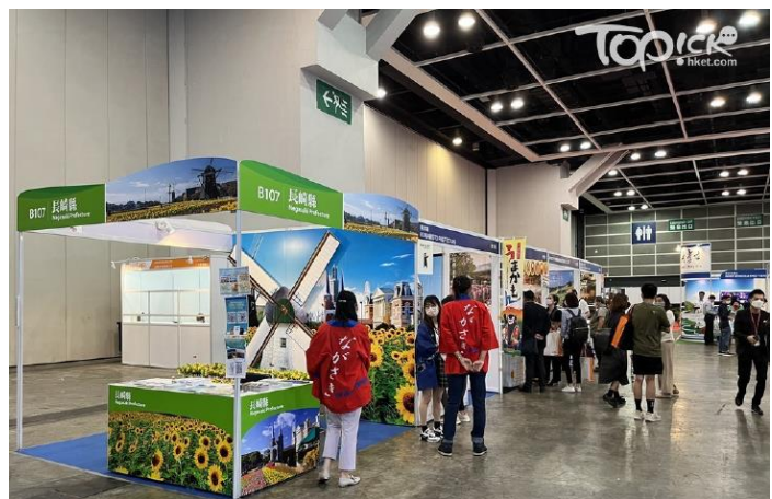
▲ 各日本縣份都有大量旅遊單張，亦有專人介紹當地景點。